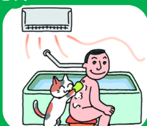
浴室用電気乾燥機