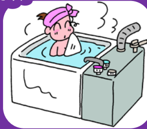
屋内式ガスふろがま (都市ガス用/プロパンガス用)