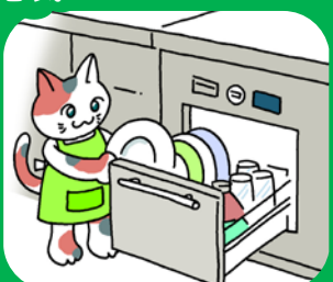
ビルトイン式電気食器洗機