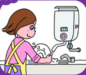
屋内式ガス瞬間湯沸器 (都市ガス用/プロパンガス用)